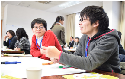
これまでの様子 (第1回 2016年1月24日、第2回 2016年3月19日開催)