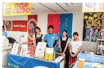
ゴールデンラビットビール