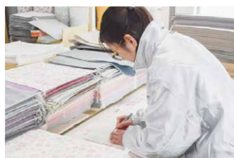
丸山繊維産業株式会社