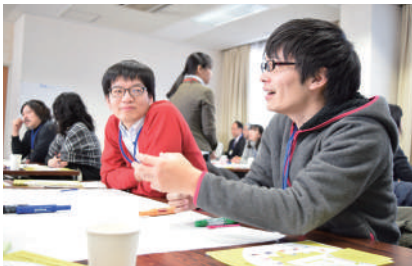
これまでの様子 (第1回 2016年1月24日、第2回 2016年3月19日開催)