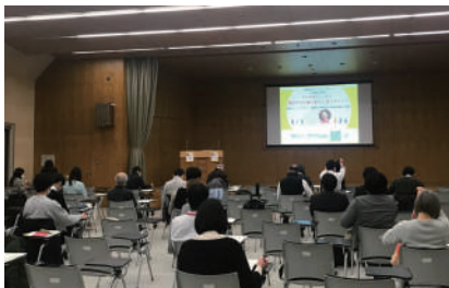
これまでの様子 (2016年3月19日、2021年3月11日開催)