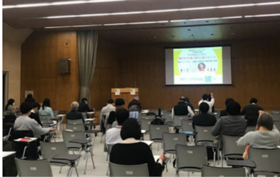
これまでの様子 (2016年3月19日、2021年3月11日開催)